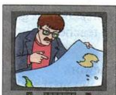
4) Alan Macmillan, a seismographer