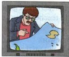
4) Alan Macmillan, a seismographer